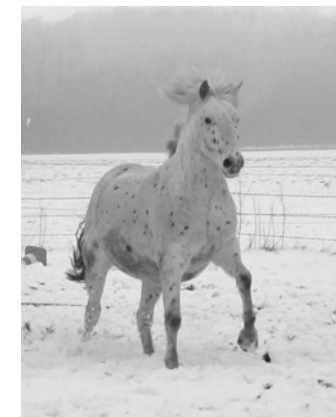
AFT interaktiv GBR

Fehrenbruch 7, 27446 Anderlingen Tel.: 04762 184587 Email: info@physio-riding.de